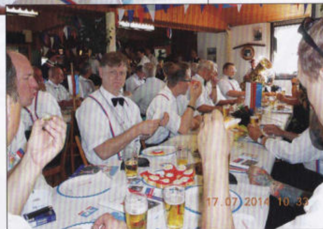
Die Stimmungslage steigt