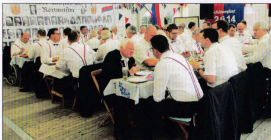
Vollbesetztes Markt- Klosterrott mit Rottmeister