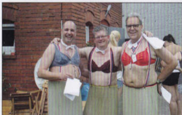
Teilnehmer des Lindentrotts probieren eine neue Dienstkleidung