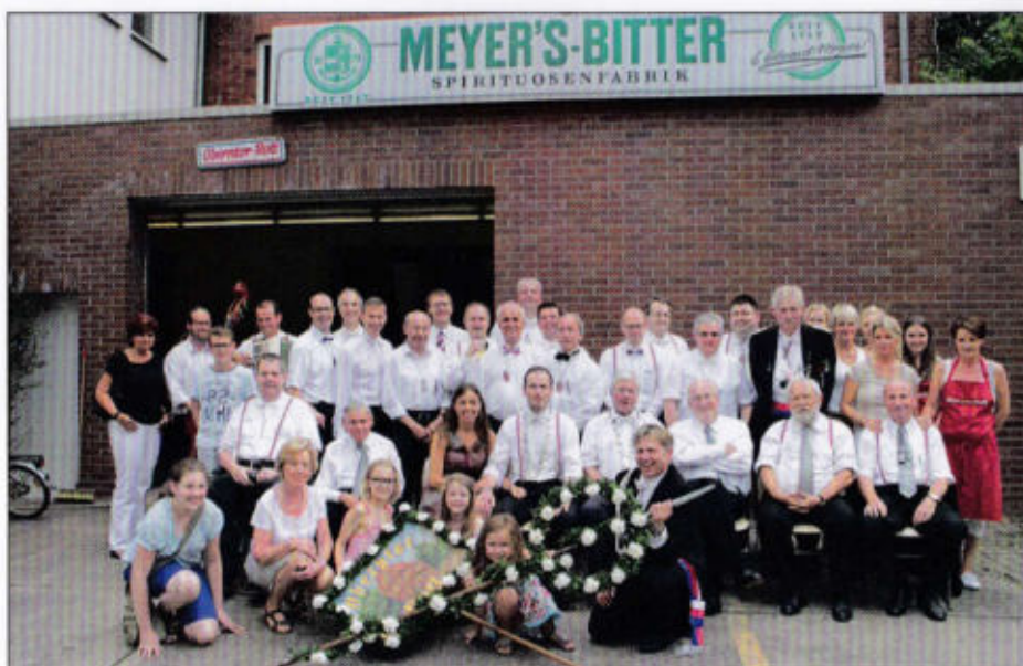
Das ganze Rott samt Damen und Berittenen - fürs Foto ohne Pferde