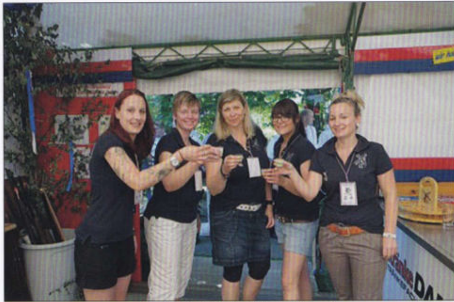
Die Rottmädel des Windmühlenrotts