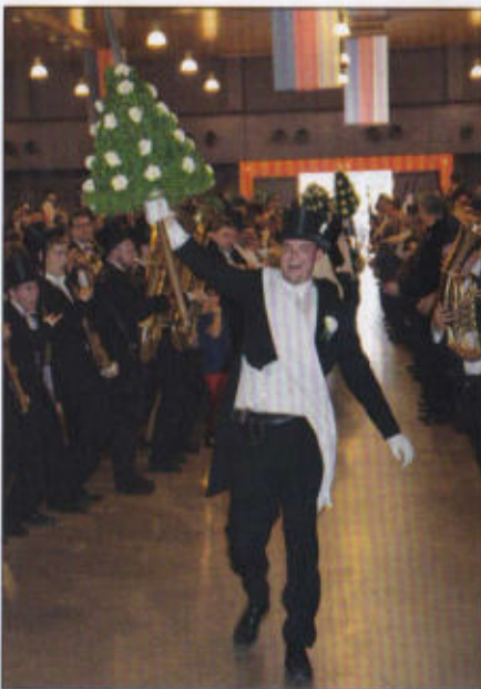
Einmarsch in die Festhalle