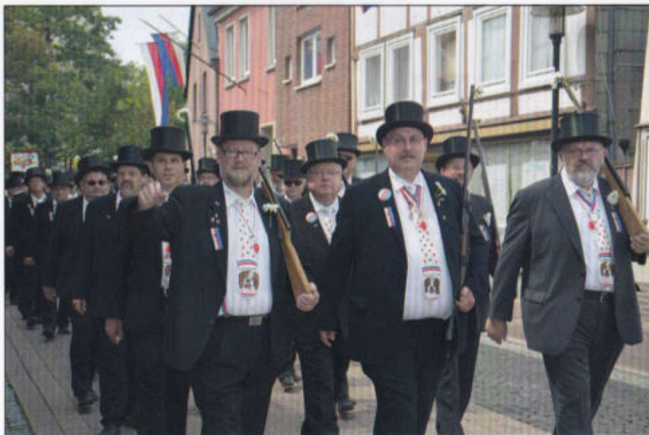
Bernhardiner Rott beim Rundmarsch.