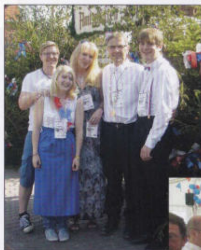
Die Rottmeisterfamilie 2014