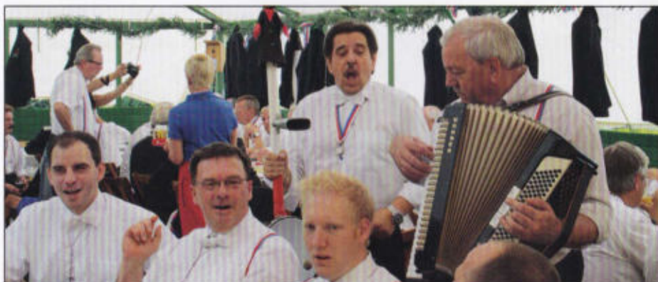
Stimmung im Lindentrott