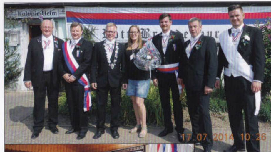
Rottmeisterpaar und Chargierte