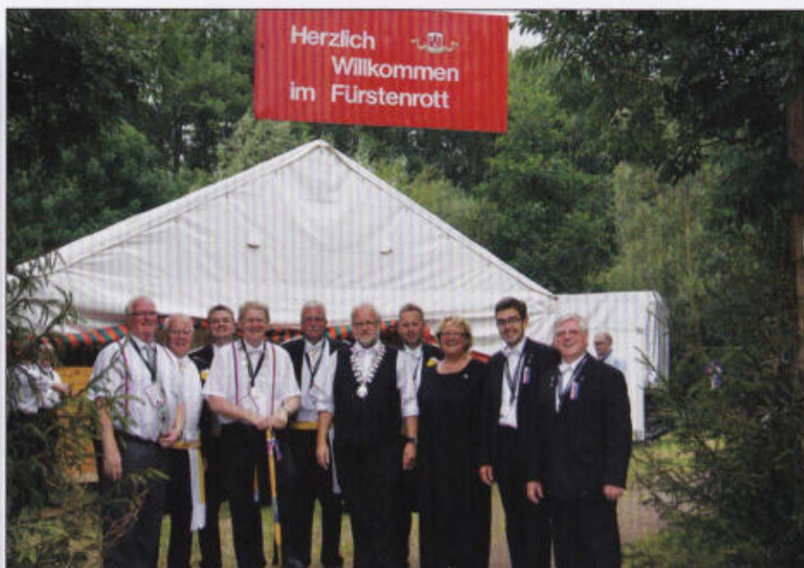
Hoher Besuch im Fürstenrott