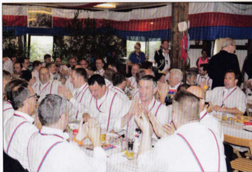
Die Stimmung im Enzer Rott nähert sich dem Siedepunkt