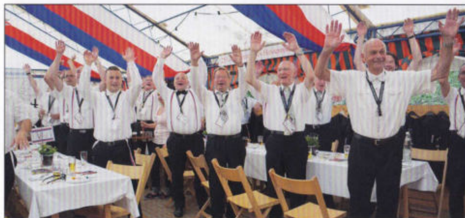
Überfall im Fürstenrott