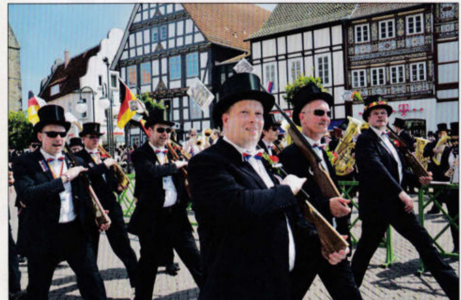
Wer macht den besten Schritt?

4. Vergangene Zeiten keh'r'n niemals wieder, / was einst Dein alles, raubt Dir der Tod. / Drum freut des Lebens Euch, singt frohe Lieder, / solang' die Jugend im Herzen loht. Drum sag ich's . . .