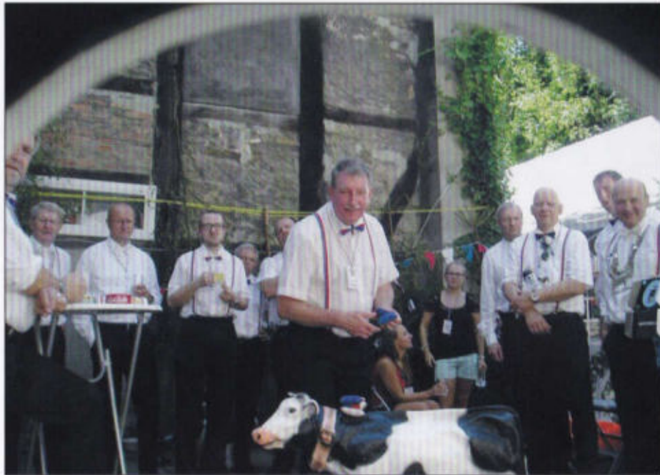
Das beliebte Wurfspiel des Kauschietenrotts