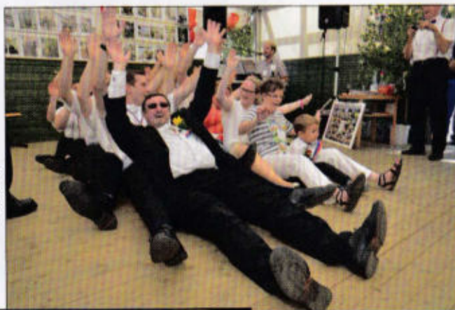
Schlittenfahrt in Rott Bahnhofstraße -Loccumer Land