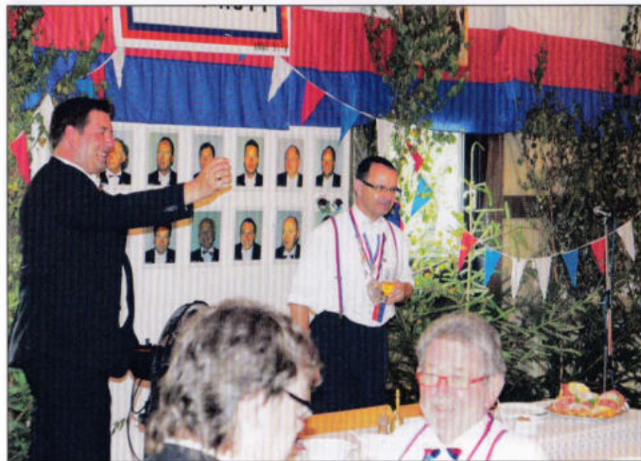
Der Rottmeister 2014 im Enzer Rott