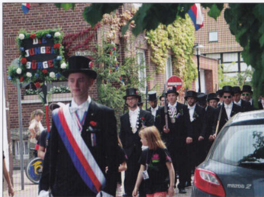
Die jungen Bürger marschieren