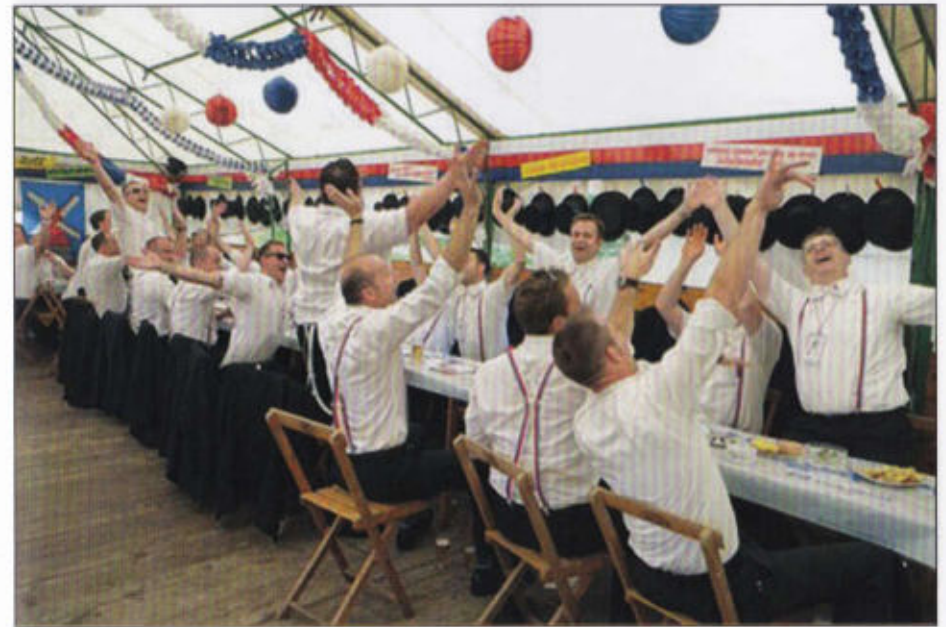
Stimmung im Windmühlenrott