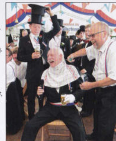
Der Hauptmann wird frisiert!!

Im schönen Stadthagen die Amtspforte lacht, wenn Rottbrüder feiern, bis spät in die Nacht!