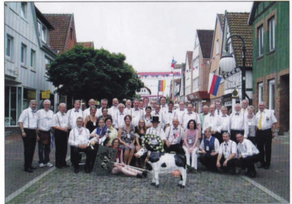
Kauschietenrott und Rottmädeln