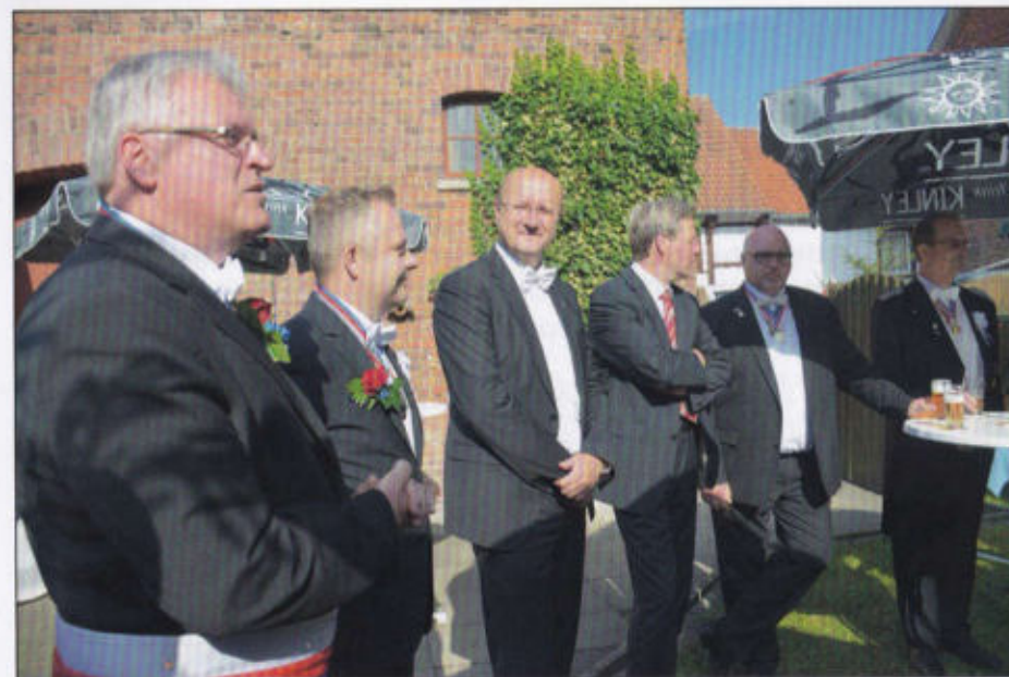
Der Hauptmann der 3. begrüßt seine Gäste

Die neue Freiheit bei der privaten Altersvorsorge: Gothaer VarioRent plus.