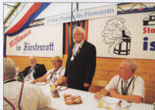
Der Rottmeister des Fürstenrotts genießt die Stimmung