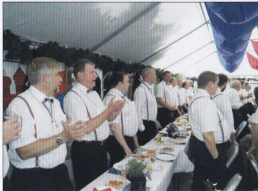
Der Männergesangsverein des Kauschietenrotts