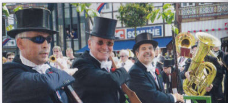
Das Lindenrott beim Vorbeimarsch