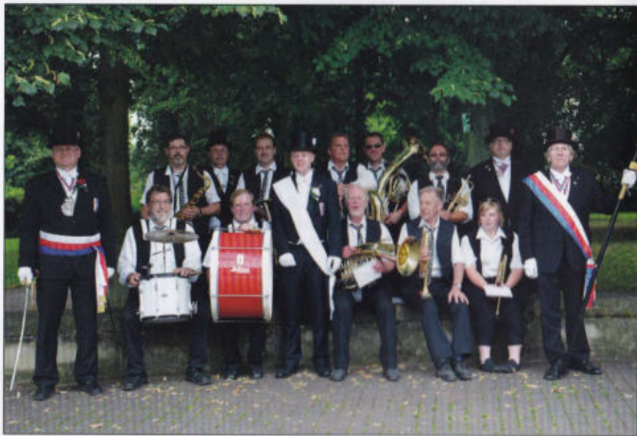
Chargierte und Musik der 3. Quartierschaft