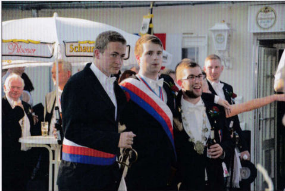
Rottmeister und Chargierte der jungen Bürger