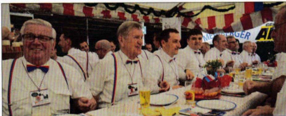
Stimmung im Rott Bahnhofstraße - Loccumer Land