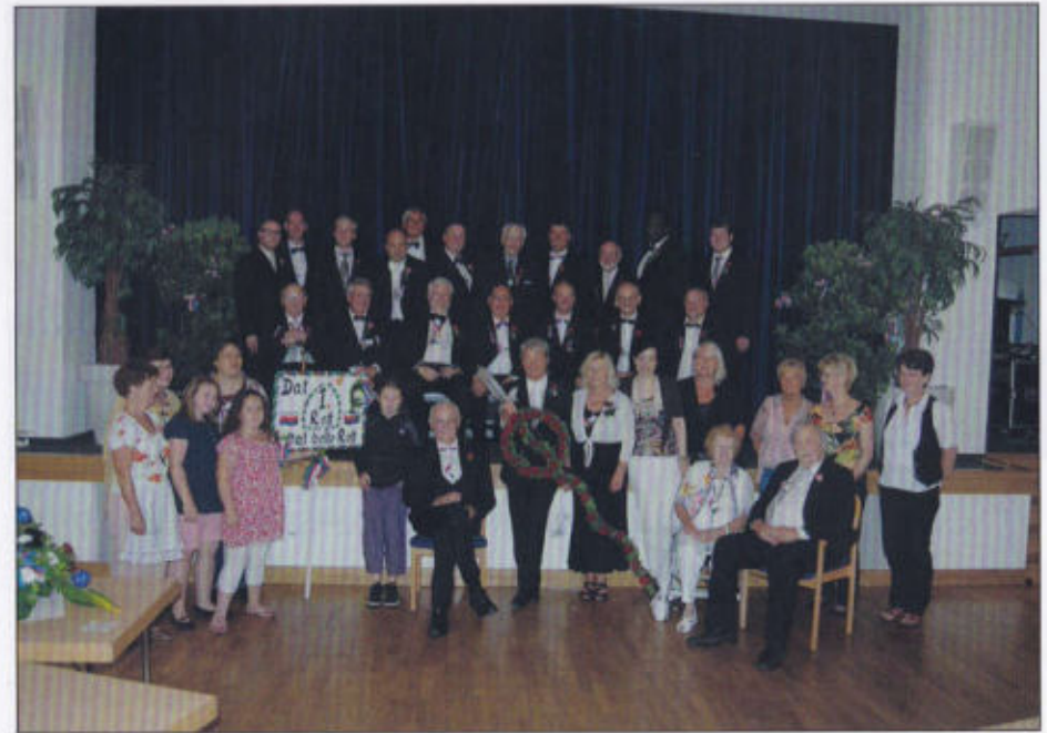
1. Rott Gruppenbild