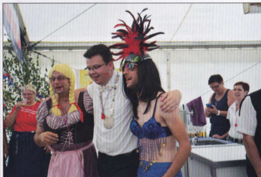
Der Rottmeister des Bernhardinerrotts begrüßt die neuen Sänger(innen)