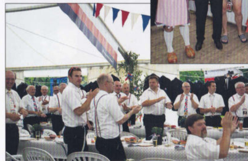
Stimmung im Bernhardiner Rott