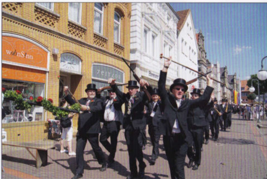
Das Fürstenrott marschiert