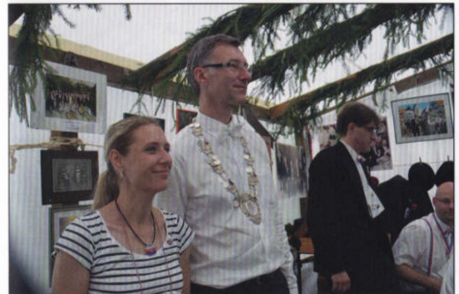
Der Rottmeister des Rosenrott begutachtet die Stimmung