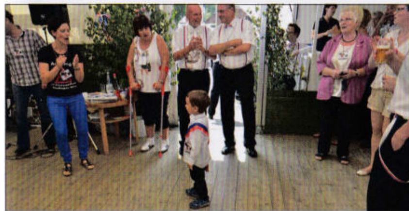
Loccumer Land - Der Rottmeister des Jahres 2035 beim üben

Wir sind gekommen heut', das ist doch klar, wir stoßen an auf das Rottmeisterpaar, und uns're Musik spielt ganz wunderbar, ja . . bar, wir freu'n uns alle schon auf's nächste Jahr.