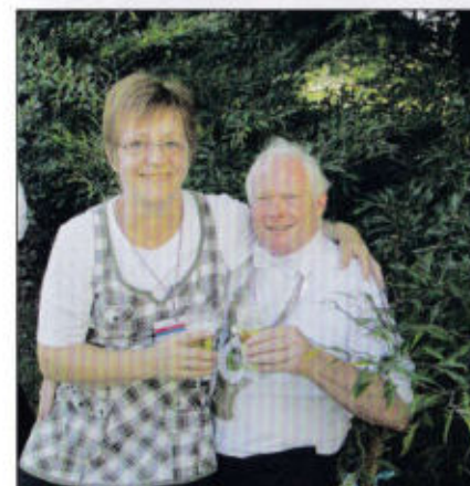
Der Rottmeister des Markt- Klosterrotts und seine bessere Hälfte

Das Schützenfest geht leider einmal vorbei, doch seid nicht traurig, nächstes Jahr auf's neu, dann geht es wieder ins Rott wohlbekannt, Ihr Schützenbrüder vom Schaumburger Land, Ihr Schützenbrüder vom Schaumburger Land. Hollada . . . im Markt-Klosterrott.