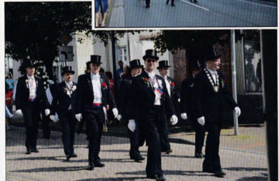
Festkomitee BM und Gäste