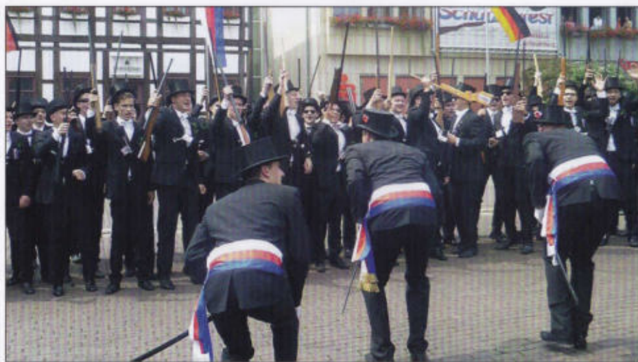
Die jungen Bürger auf dem Marktplatz