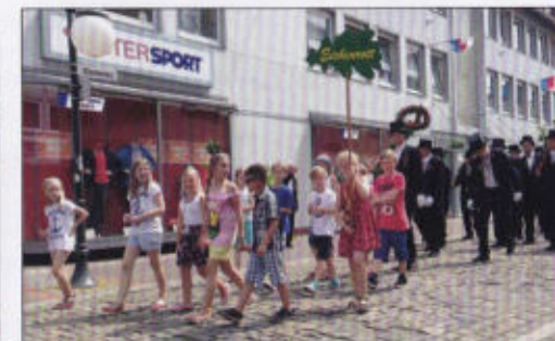
Das Eichenrott marschier