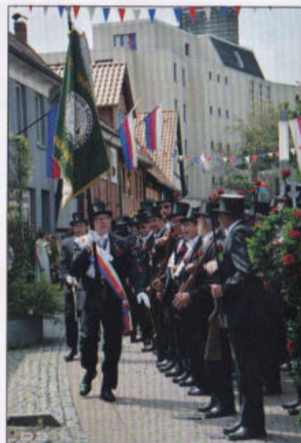
Fahnenappell der 3. Quartierschaft