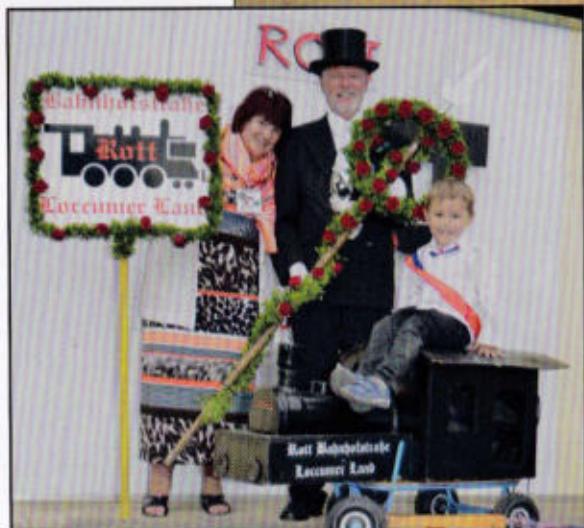
Der Rottmeister des Rotts Bahnhofstraße - Loccumer Land und sein Handwerkszeug