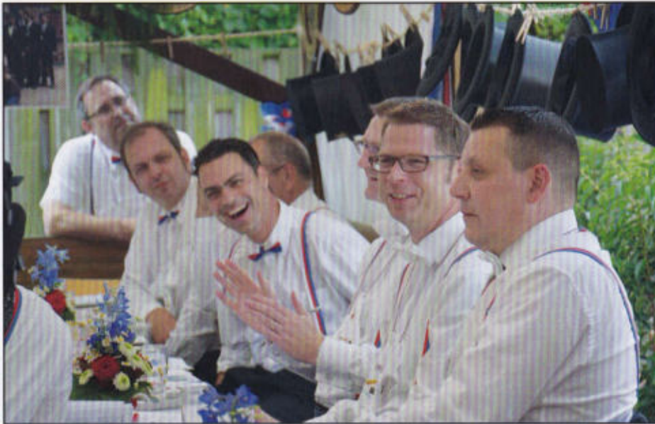
Rottleben im Rosenrott