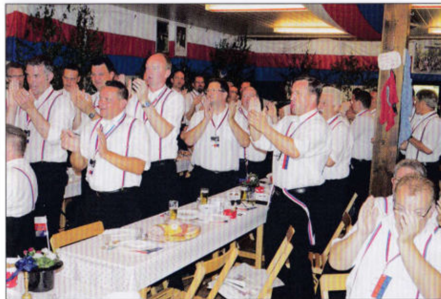
Schön ist es wieder im Enzer Rott