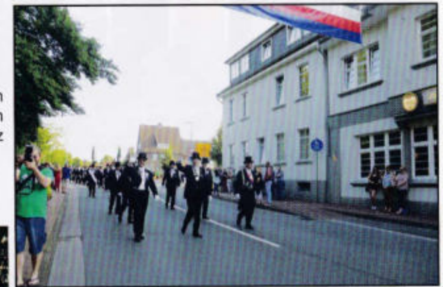
Abmarsch der Jungen Bürger zum Marktplatz

Ist auch der Beutel nicht so straff, der Zylinder nicht so fein, das kündigt uns doch gar nicht sehr, wir woll'n nur lustig sein! Mutter, den Zylinder her, die Blume und das Holzgewehr; Mutter, den Zylinder her, die Blume und's Gewehr! Hei!