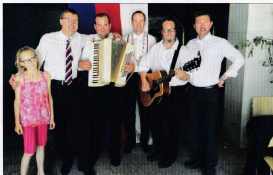
Die lustigen Musikanten - auch in diesem Jahr soll das so sein!