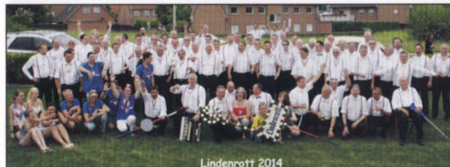
Gruppenbild und Rottmädeln

Der dies neue Lied erdacht, / Sang's in einer Sommernacht / Lustig in die Winde. / Vor ihm stand ein volles Glas, / Neben ihm Frau Wirtin saß / unter der blühenden Linde.