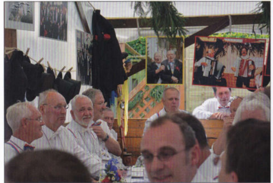
Das Rottzelt des Rosenrotts ist wieder voll