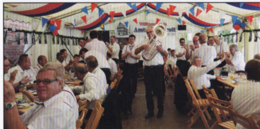
Die Rottkapelle sogt für Spaß und gute Laune