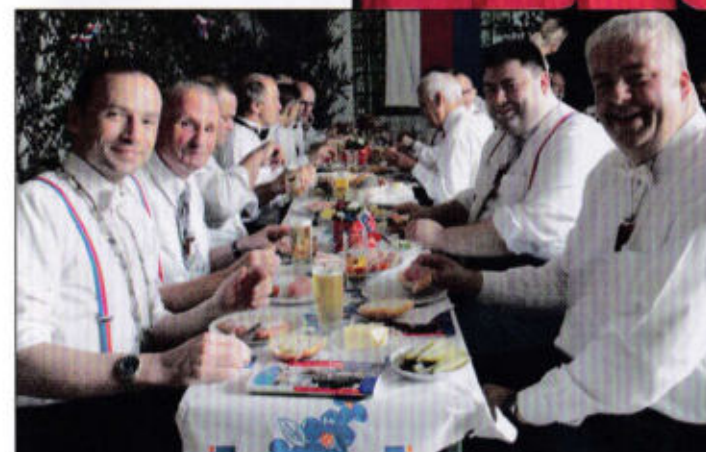
Ein Rottmeister für 2015! Das schmeckt!