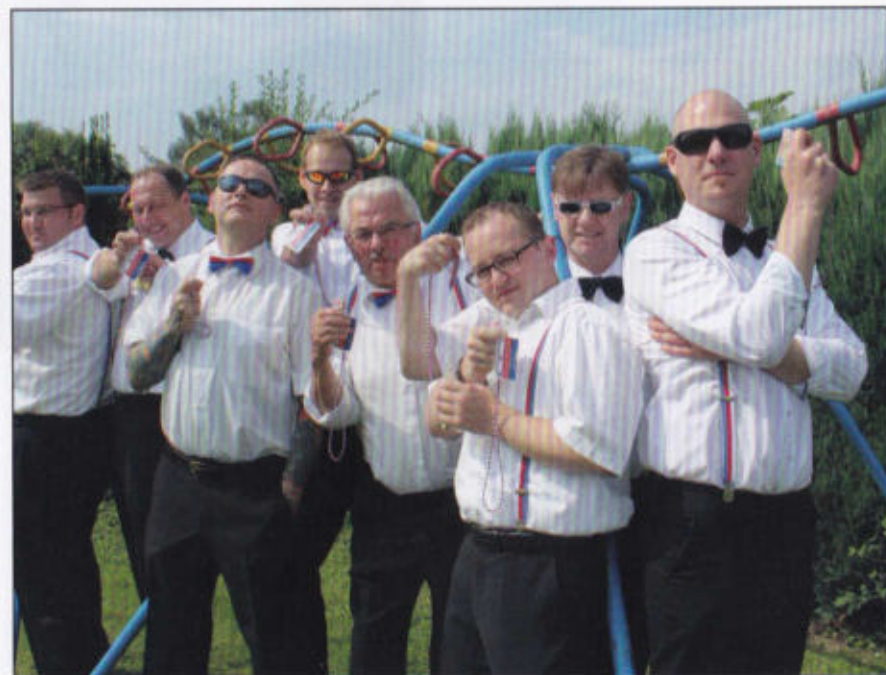
Mafiöse Zustände im Rott Brandenburger Tor

Der zweite Tag besonders schwer mit Blumen und dem Holzgewehr. Das nächste Rott, das ist doch klar, ist hier bei uns im nächsten Jahr. Der Marktplatz ist für uns so weit doch zwei Stunden haben wir noch Zeit. Parademarsch marschieren wir, doch trinken lieber Schnaps und Bier!