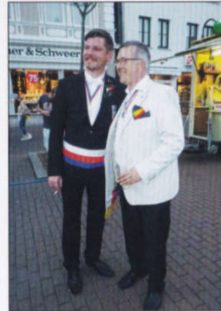
Der alte und der neue Hauptmann der 2.

Obernstr. 55 | Stadthagen | 05721/77677 | www.hilgenfeld.de