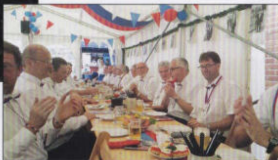
Supter Stimmung beim Amtspfortenrott