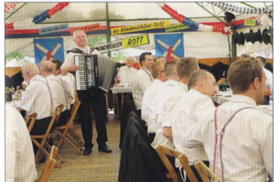
Die Musike spielt im Windmühlenrott