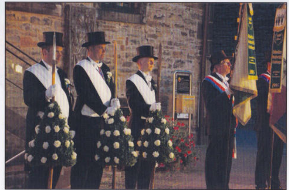
Feierliche Stimmung beim Zapfenstreich