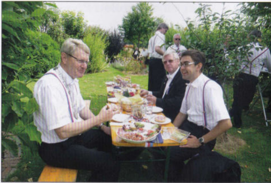
Rottfrühstück im Grünen