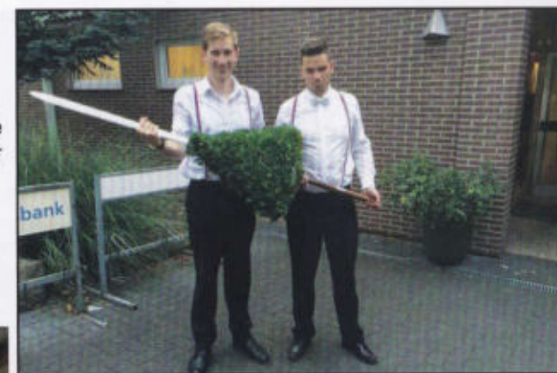
Der alte und der neue Schlachtschwertträger

Volksdorf 35 · 31715 Meerbeck · Tel. 05721 - 97210 · Fax 05721 - 91031 info@vehling-motorgeraete.de · www.vehling-motorgeraete.de