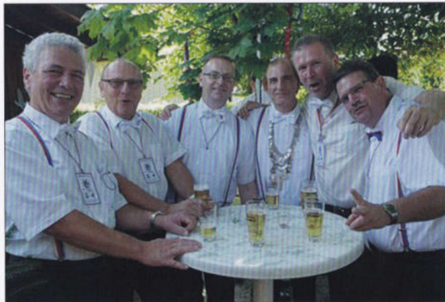
Eine Abkühlung im Windmühlenrott