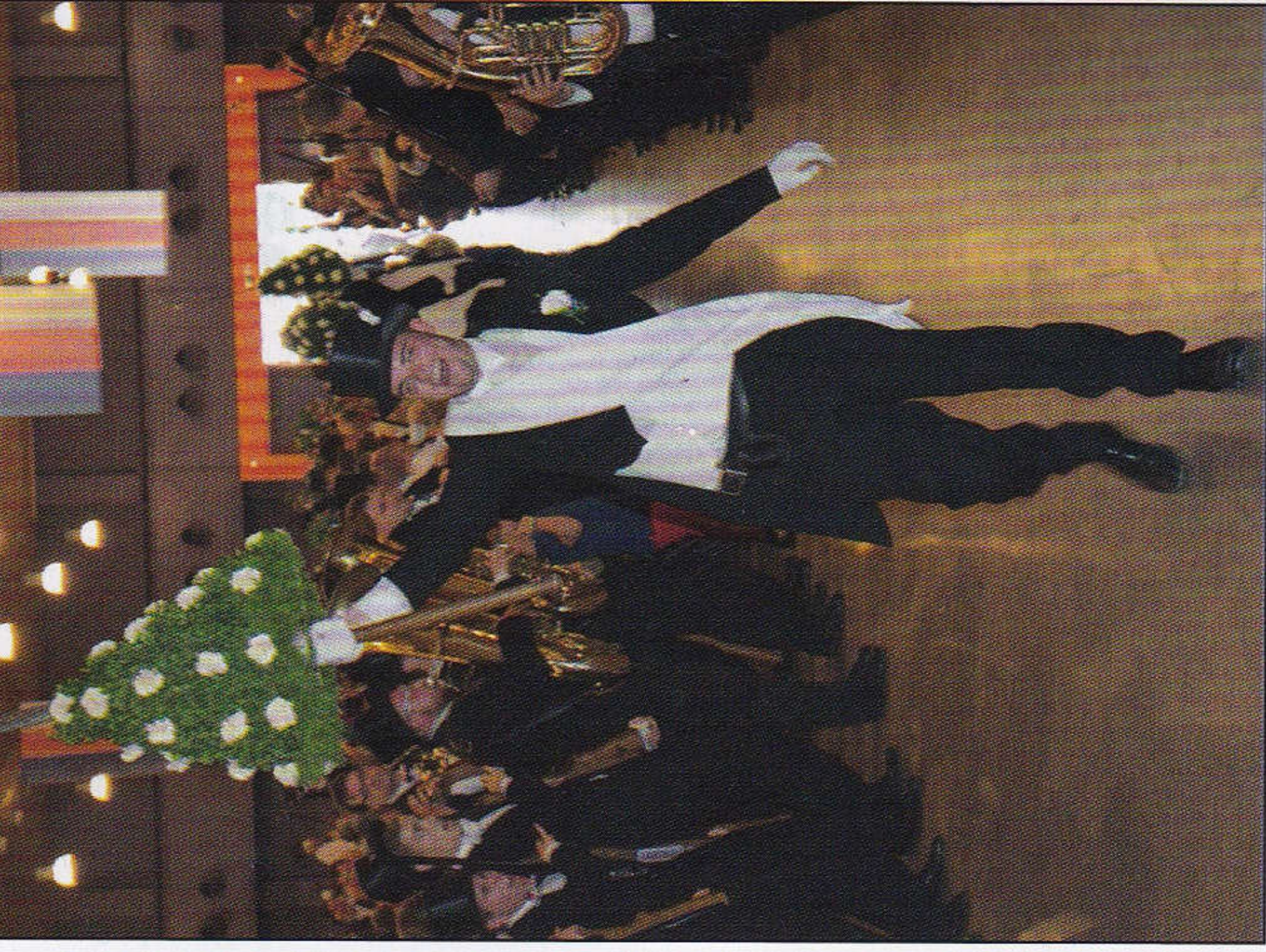
Einmarsch in die Festhalle