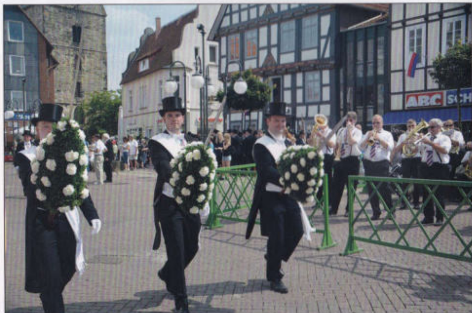
Die drei Schlachtschwerter!