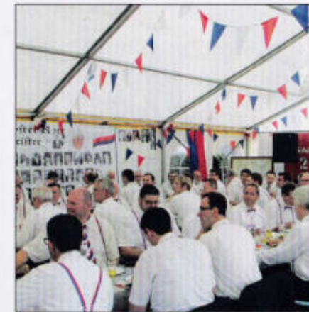
Stimmung im Rottzelt