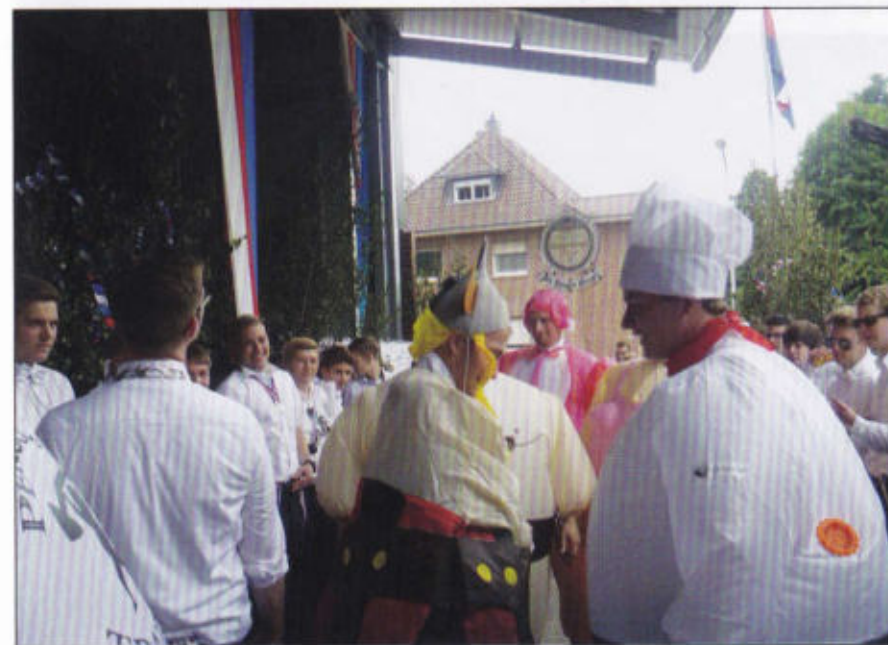
Seltsamer Besuch bei den jungen Bürgern