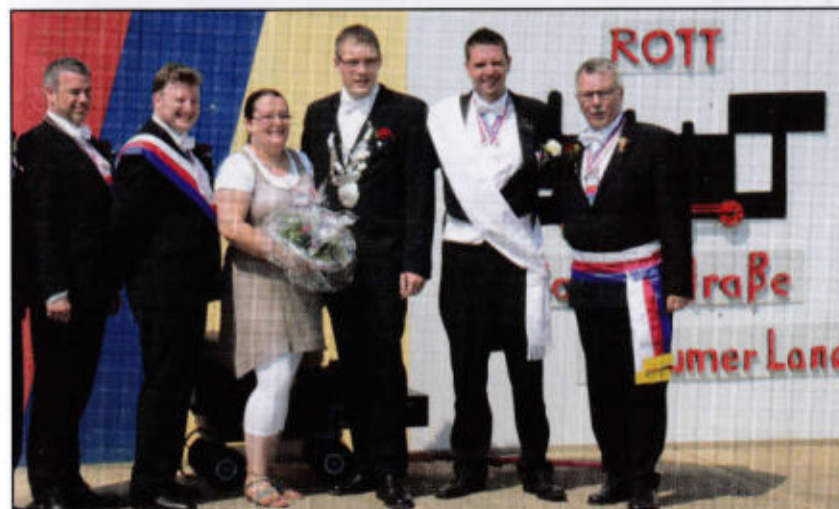
Rottmeister und Frau Bahnhofstr. Loccumer Land

Das Schützenfest geht leider einmal vorbei, doch seid nicht traurig, nächstes Jahr auf's neu, dann geht es wieder ins Rott wohlbekannt, Ihr Schützenbrüder vom Schaumburger Land, Ihr Schützenbrüder vom Schaumburger Land. Hollada . . . im Markt-Klosterrott.