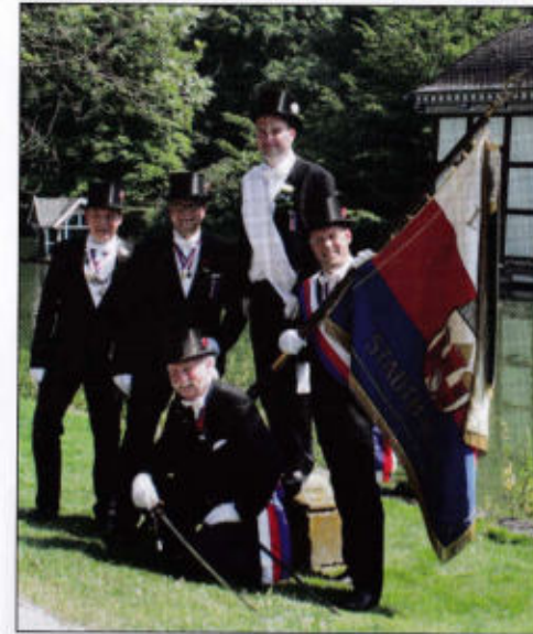
Schützenfest 2014 Chargierte 1. Quartierschaft