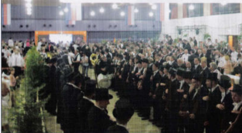
Gefüllte Festhalle mit Einmarsch