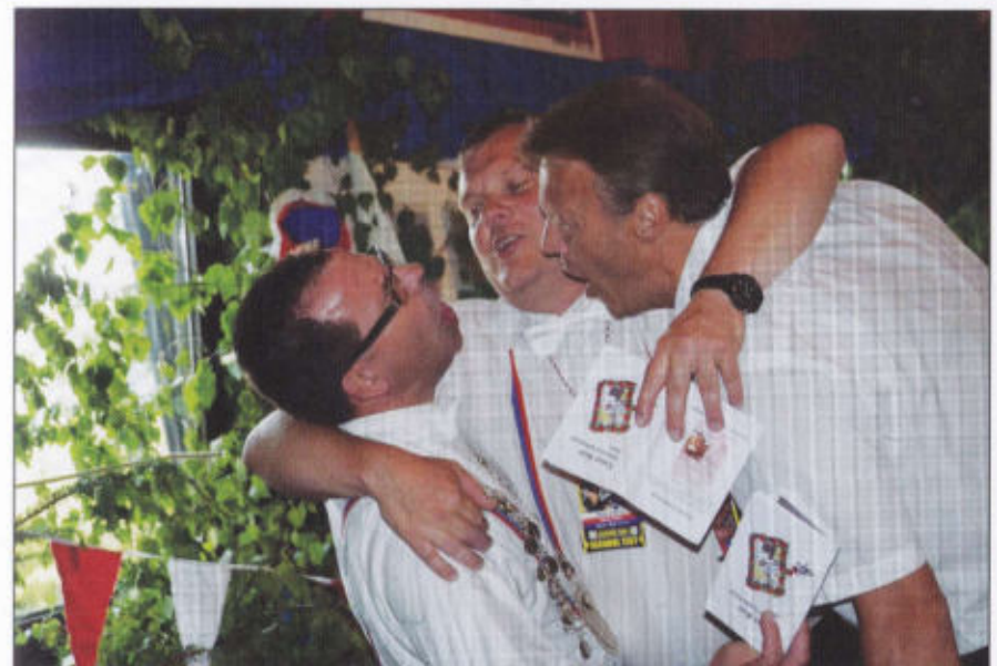
Wahre Freunde gibt es nur unter Männern im Enzer Rott