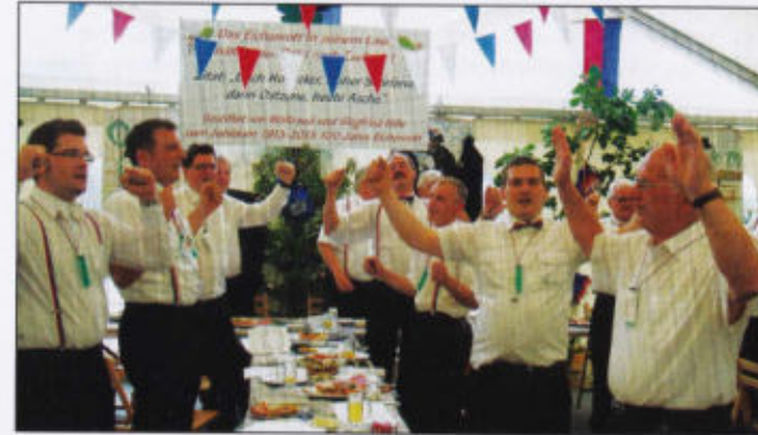
Feiern im Eichenrott

Du liebes, altes Eichenrott! – Dir halten wir die Treu! – Wir sind, so wolle unser Gott, – im nächsten Jahr dabei.