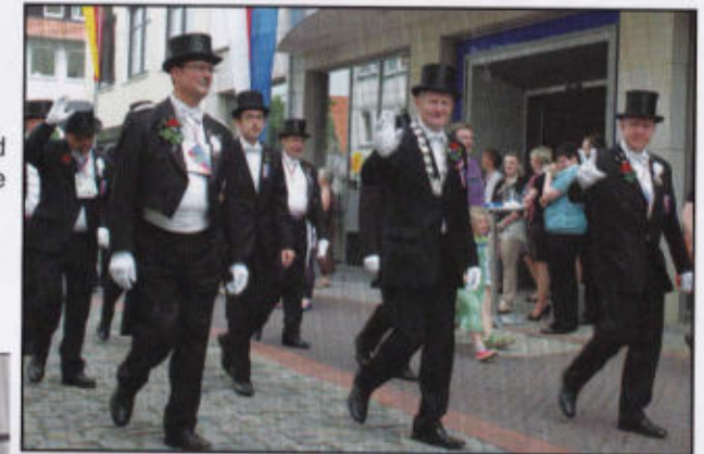
BM und Festkomitee

Ist auch der Beutel nicht so straff, der Zylinder nicht so fein, das kümmert uns doch gar nicht sehr, wir woll'n nur lustig sein! Mutter, den Zylinder her, die Blume und das Holzgewehr; Mutter, den Zylinder her, die Blume und's Gewehr! Hei!