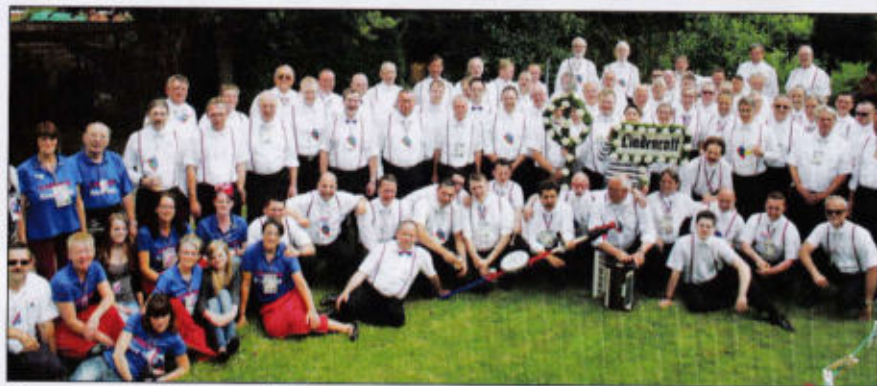
Gruppenbild mit Damen Lindenrott