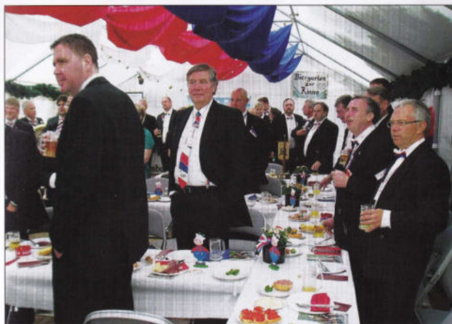
Kauschietenrott beim feiern