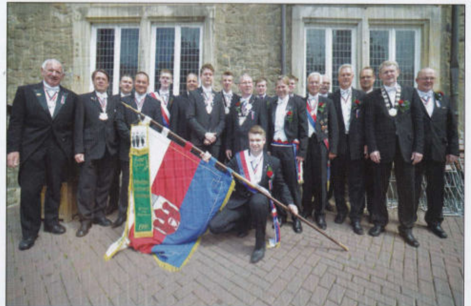
Ehrung der besten Schüsse 2013 beim Empfang der Stadt im Rat