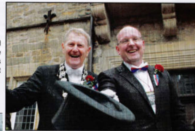
Der Kreisoberste und der Stadtoberste haben sich nass gemacht

Volksdorf 35 · 31715 Meerbeck · Tel. 05721 - 97210 · Fax 05721 - 91031 info@vehling-motorgeraete.de · www.vehling-motorgeraete.de