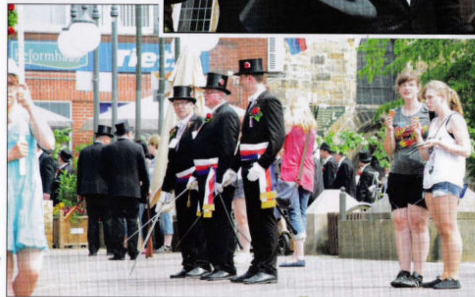
Hauptleute Junge Bürger 2. und 3. Quartierschaft Schützenfest