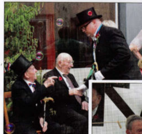
Die ältesten Rottbesucher ruhen sich aus