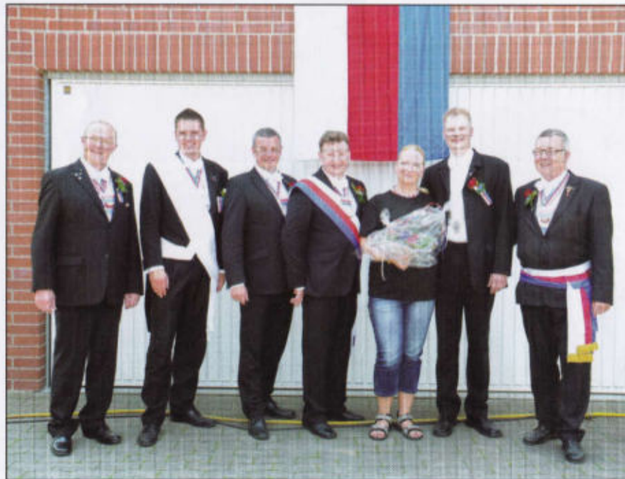
Rottmeister und Frau Brandenburger Tor

Der zweite Tag besonders schwer mit Blumen und dem Holzgewehr. Das nächste Rott, das ist doch klar, ist hier bei uns im nächsten Jahr. Der Marktplatz ist für uns so weit doch zwei Stunden haben wir noch Zeit. Parademarsch marschieren wir, doch trinken lieber Schnaps und Bier!