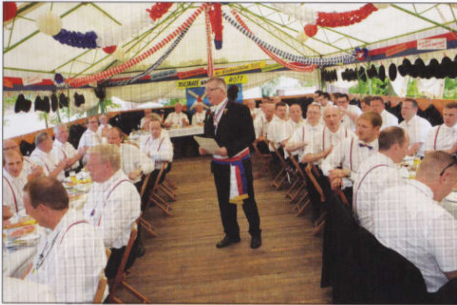
100 Jahre Windmühlenrott