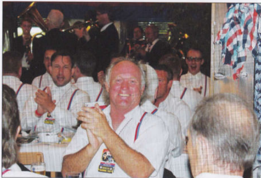
Schön ist es wieder im Enzer Rott