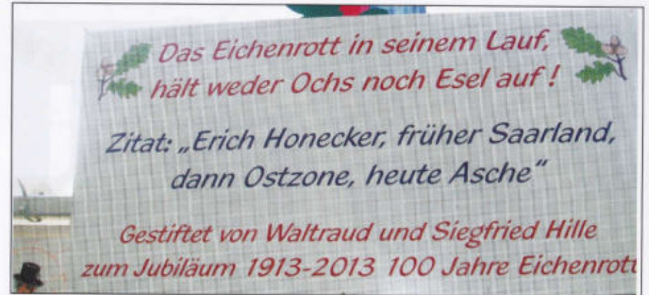
Motto im Eichenrott