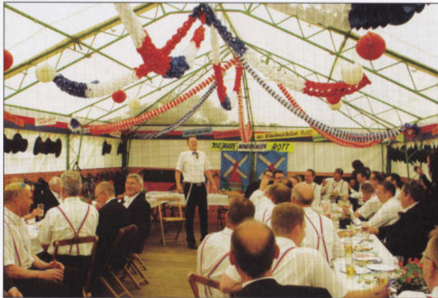
Ein guter Witz im Windmühlenrott