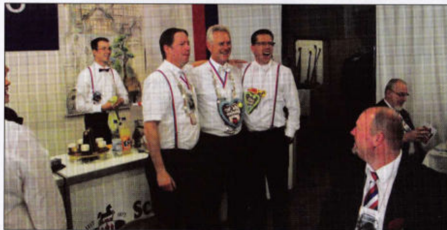
Der beste Schuß in seinem Rott