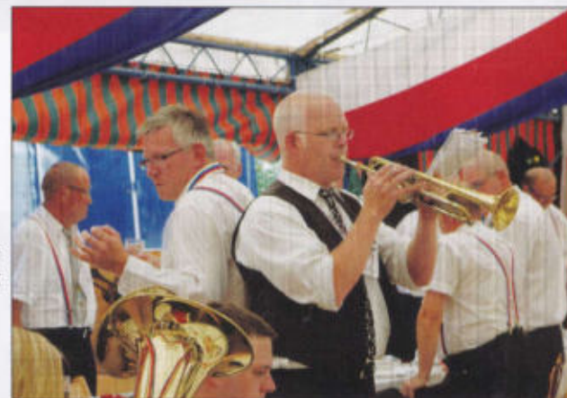
Musik spielt im Fürstenrott