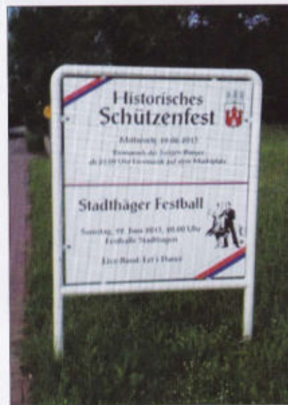
Werbung für unser Schützenfest