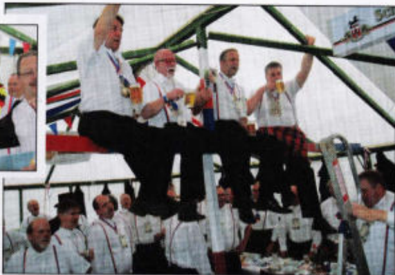
Der berühmte Hahnenbalken im Lindenrott.