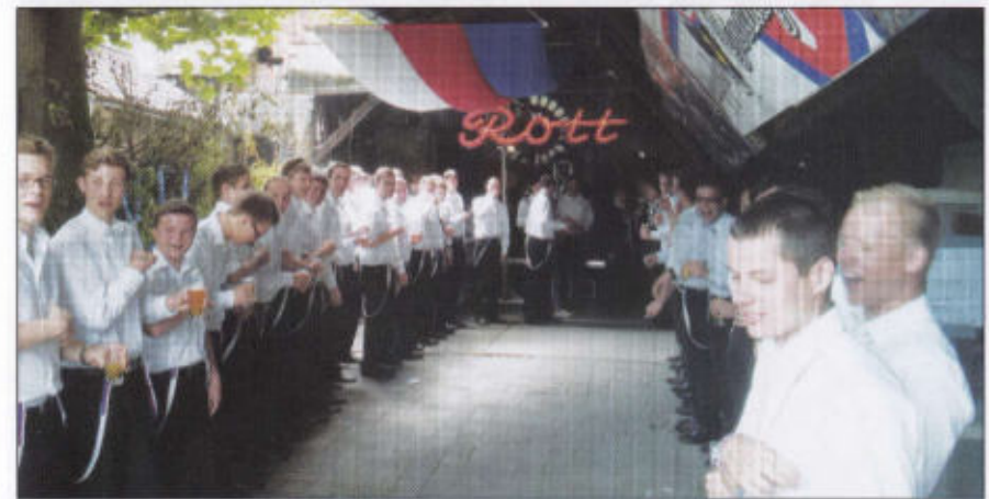
Junge Bürger stehen Spalier