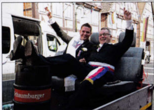
Schaumburger forever Schützenfest 2013