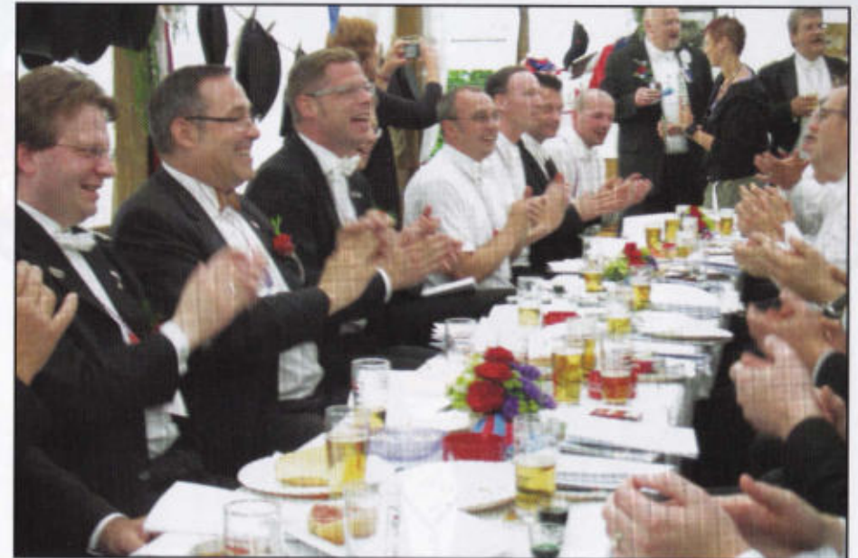
Feiern und Singen im Rott