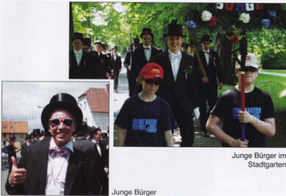
Junge Bürger im Stadtgarten