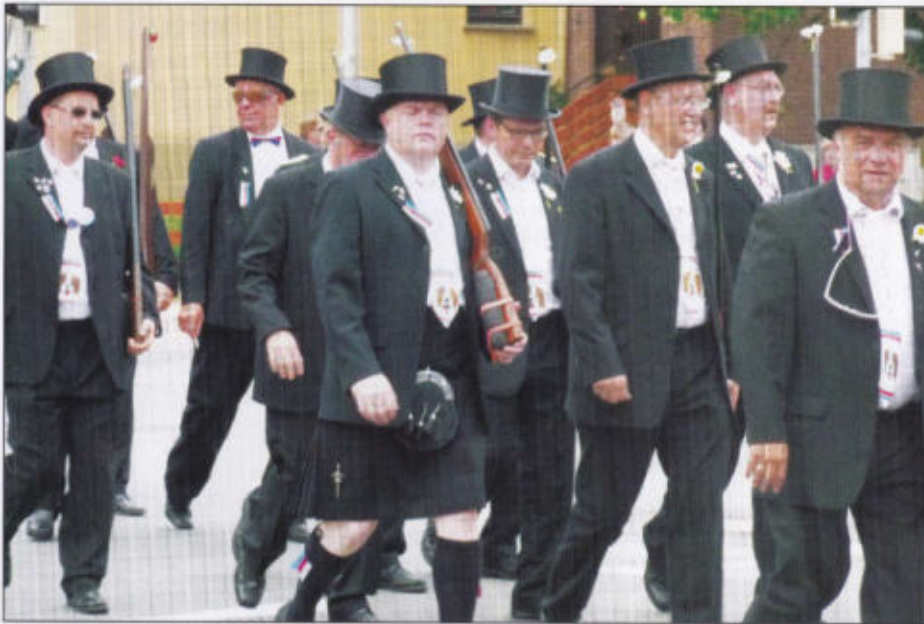
Berhardiner Rott beim Rundmarsch.