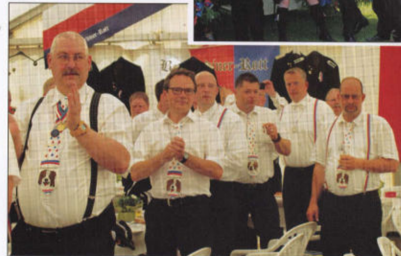
Stimmung im Bernhardiner Rott