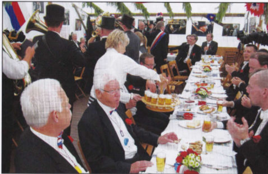
Rottleben im Rosenrott