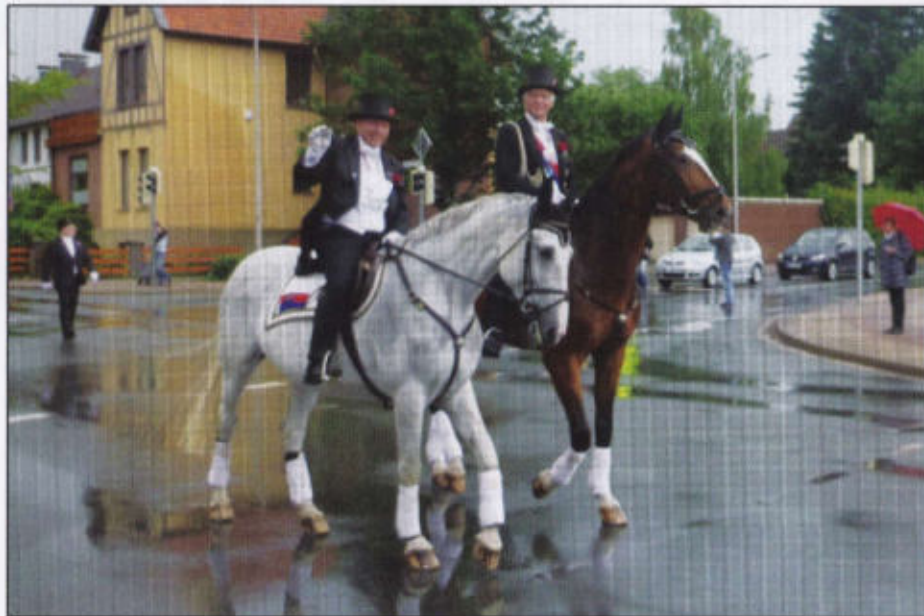
Stellvertr. Stadtmajor und stellvertr. Adjutant