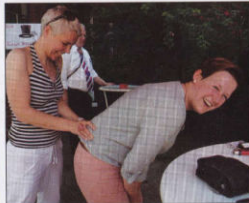
Die Rottfahrerinnen der 2.