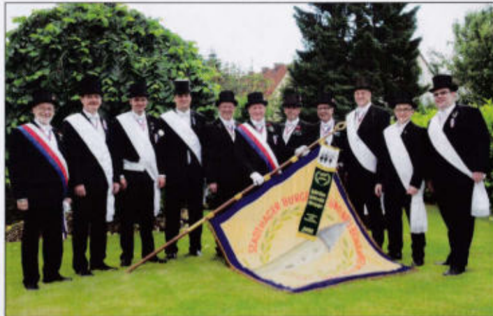
Hauptmann der 2. und seine Chargierten

Heil! Wie die Gläser klangen, da brannte Hand in Hand; . . . Es lebe die Liebste deine, ja deine, Herzbruder, im Vaterland . . .