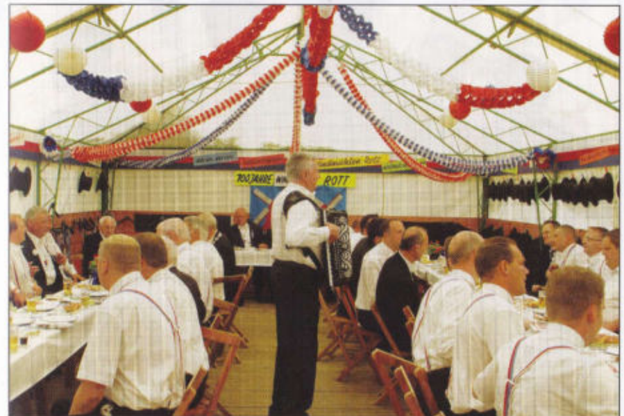
Musike spielt im Windmühlenrott