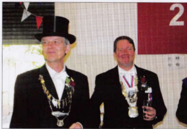
Markt-Kloster-Rott Rottmeister und Heringskönig