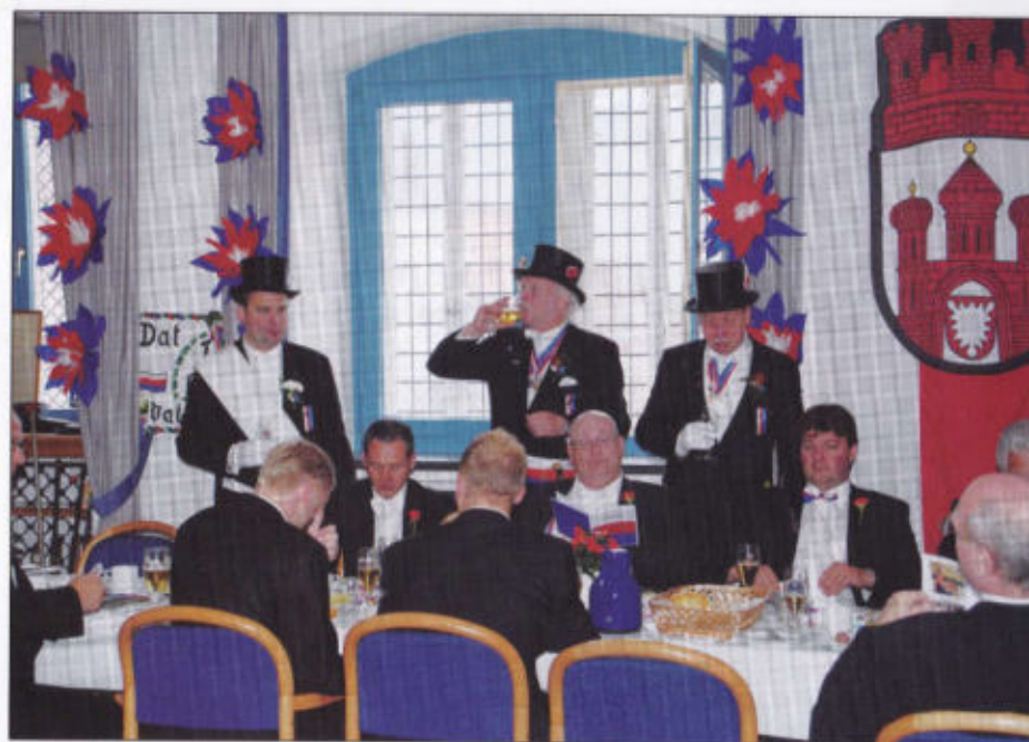
1. Rott im Ratskeller und Gruppenbild