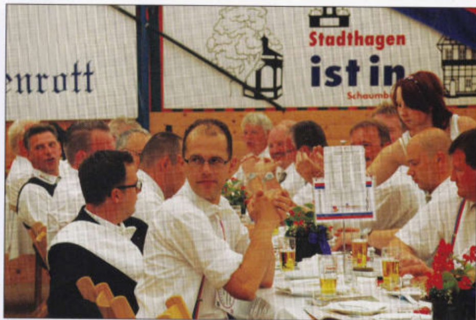
Feiern im Fürstenrott