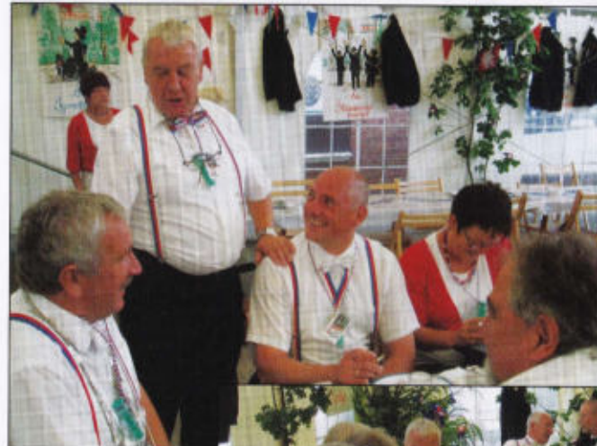
Witze erzählen im Eichenrott