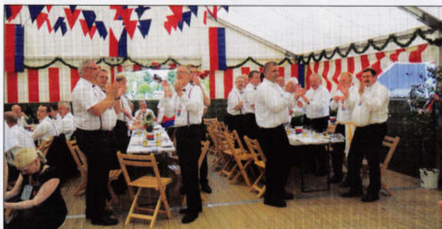
Rott Bahnhofstrasse Schützenfest