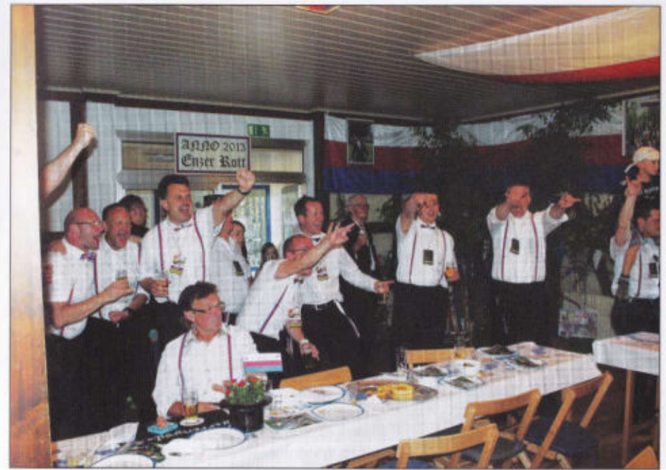
Stimmung im Enzer Rott