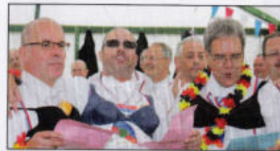
Gesangskünstler im Lindenrott