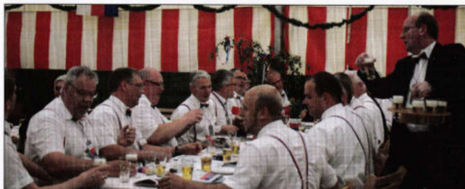
Landrat serviert Bier im Rott Bahnhofstrasse