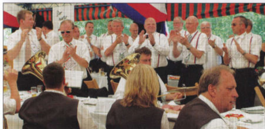
Stimmung im Fürstenrott