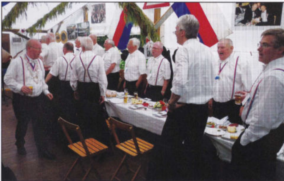
Rottleben im Rosenrott