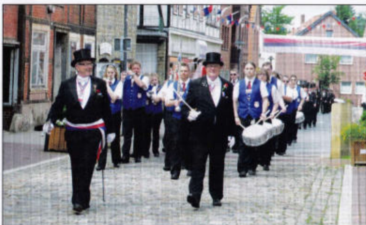
Spitze 2. Quartierschaft mit Spielmannszug