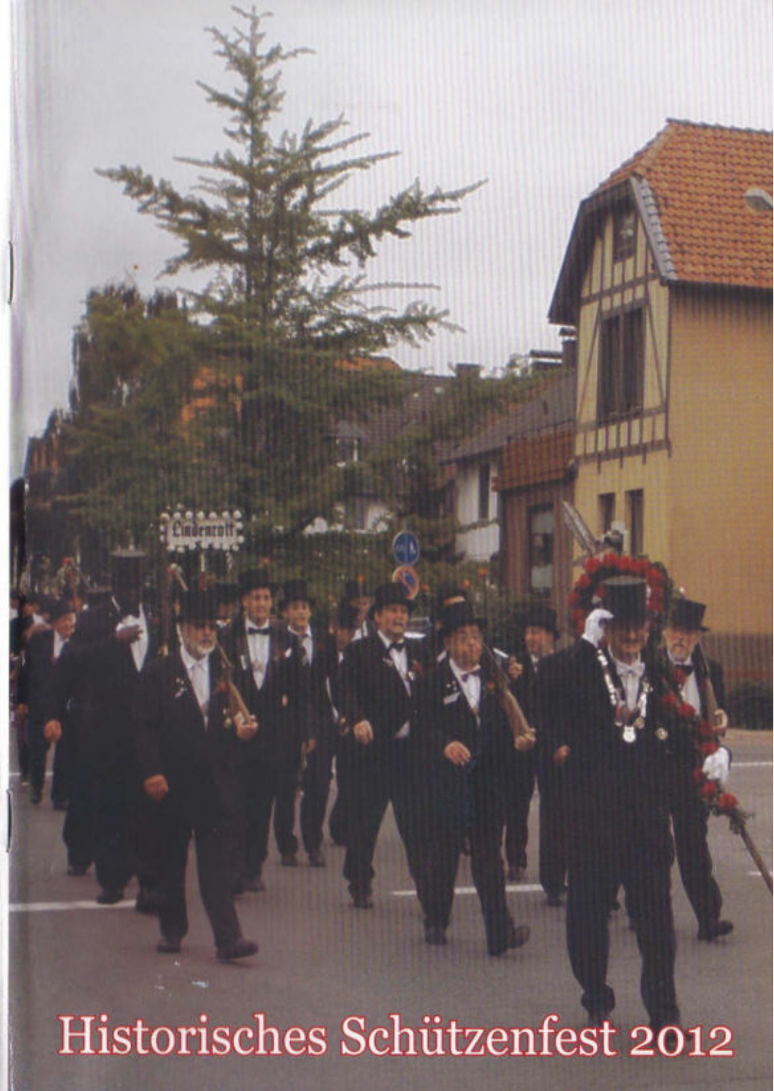
Historisches Schützenfest 2012