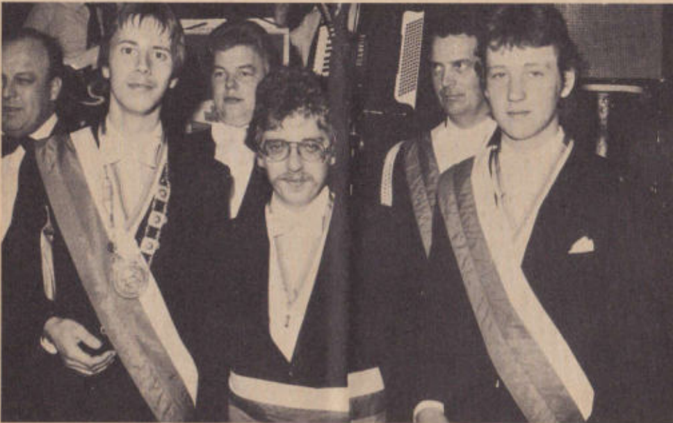
Treffpunkt aller jungen Bürger ist 1980 das Rottlokal in Lambrechts Mühle (Schaumburger Brauerei)