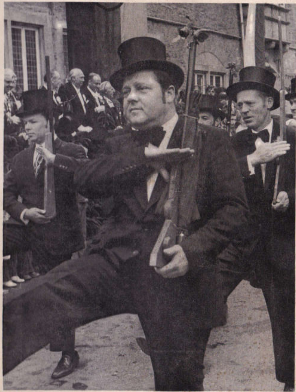
Historisches Schützenfest 1975