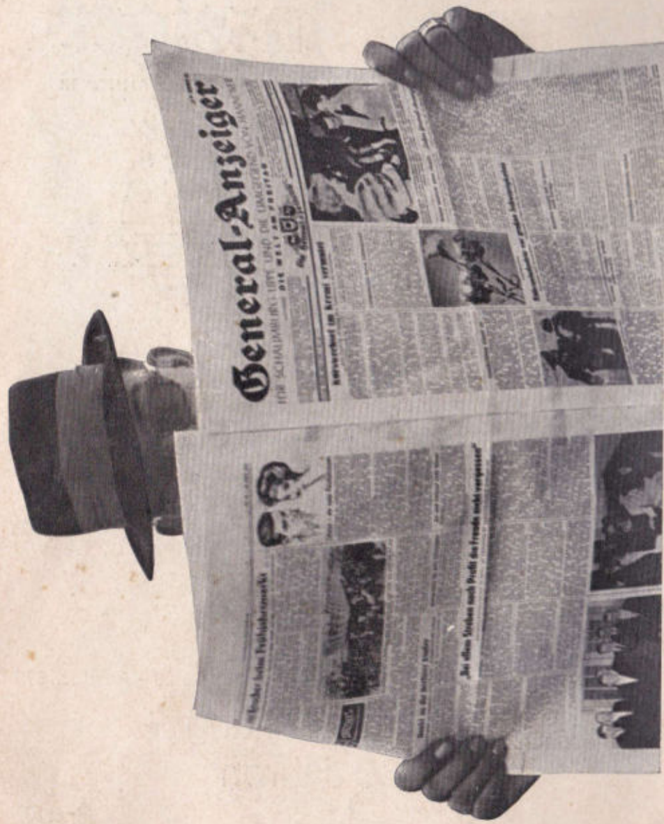
Herausgegeben vom General-Anzeiger-Verlag Druck: H. Weige, Stadthagen