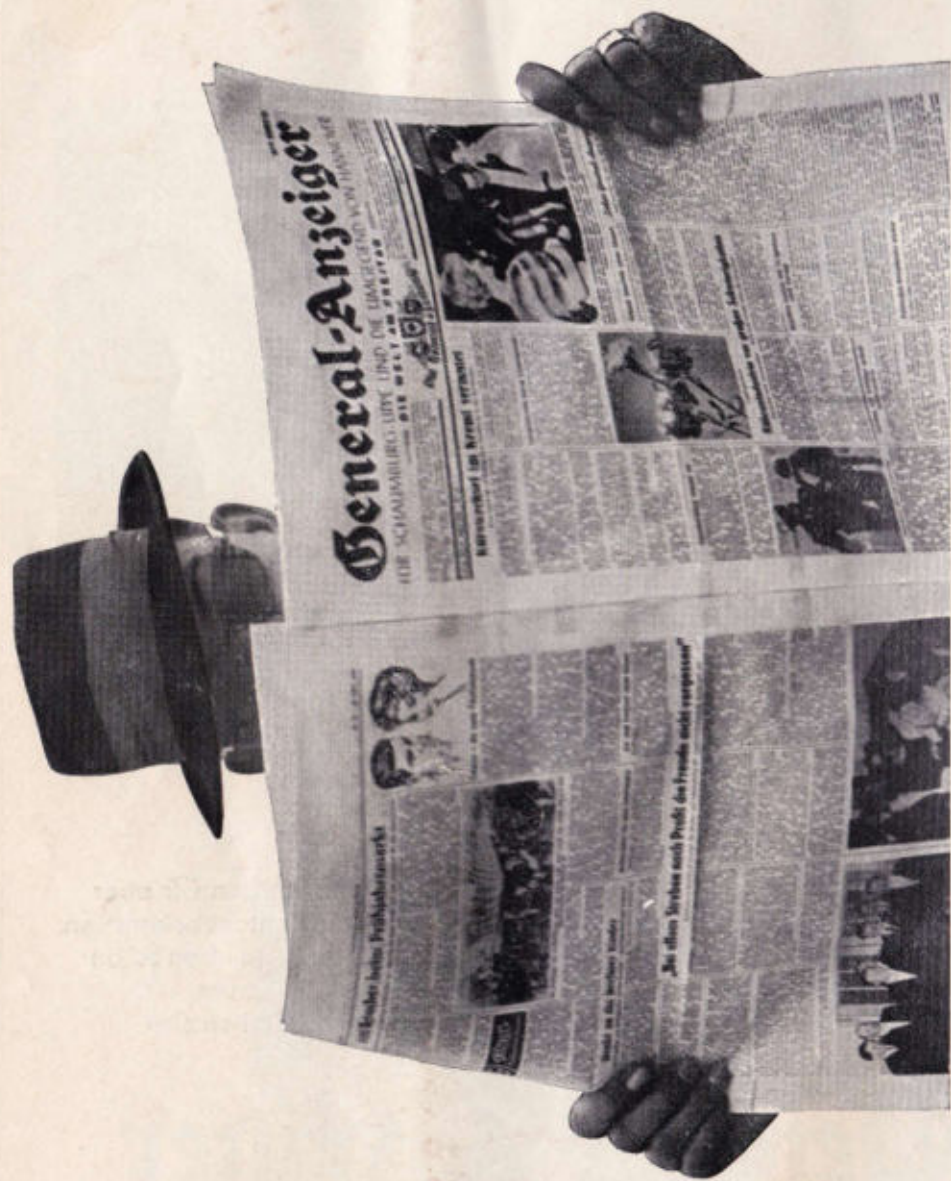
Herausgegeben vom General-Anzeiger-Verlag Druck H. Welge, Stadthagen