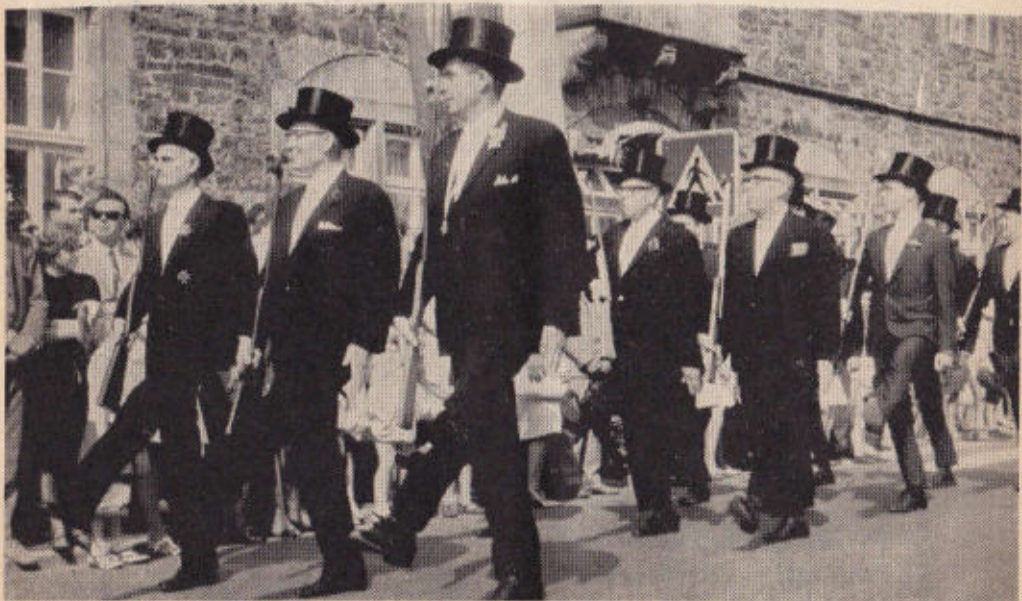
Vorbeimarsch auf dem Marktplatz