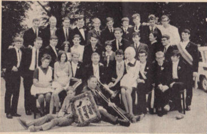
Junge Bürger der Unterstadt