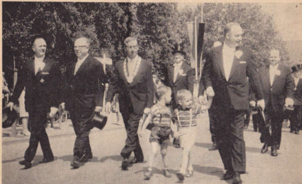
Kinderfest am Sonnabend