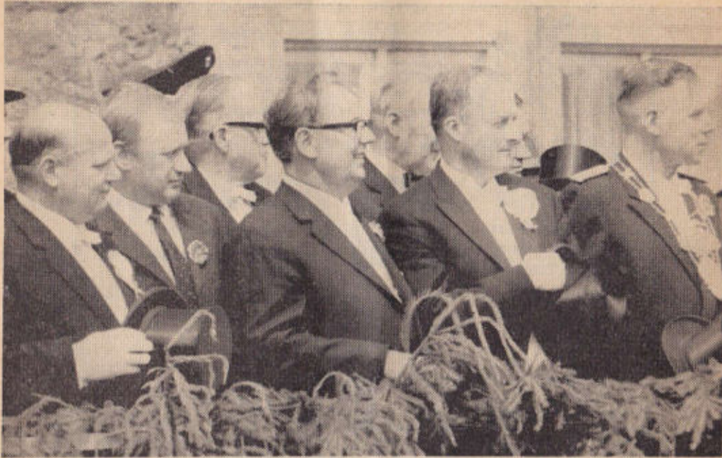
Gäste vor dem Rathaus