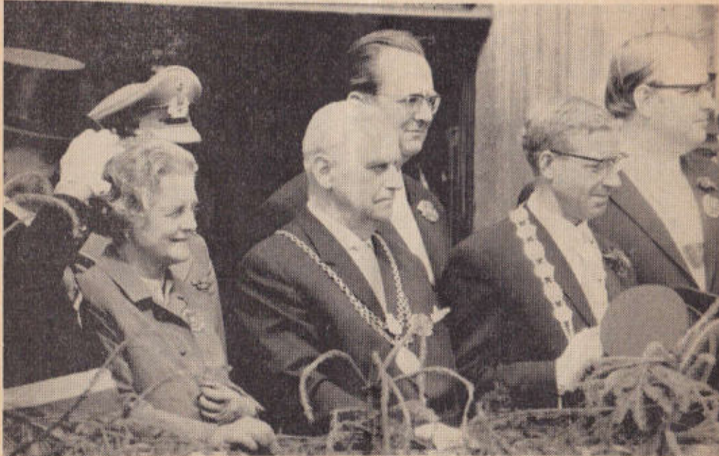
Parade auf dem Marktplatz