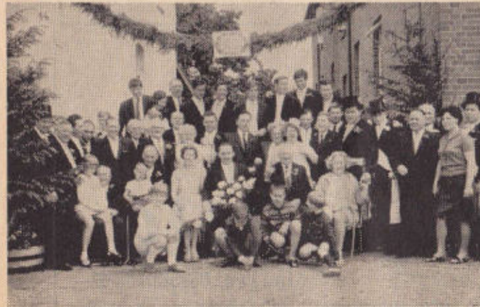
Rott Windmühlen- straße