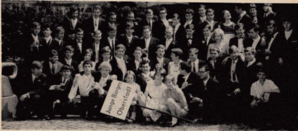
Junge Bürger Oberstadt

... treue Helfer der Hausfrau sind Elektrogeräte aus Ihrem Fachgeschäft für Elektrotechnik