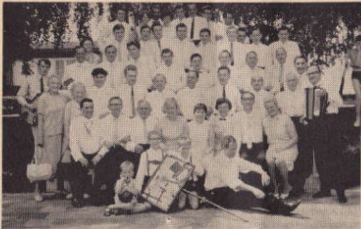
Rott Enzer Straße