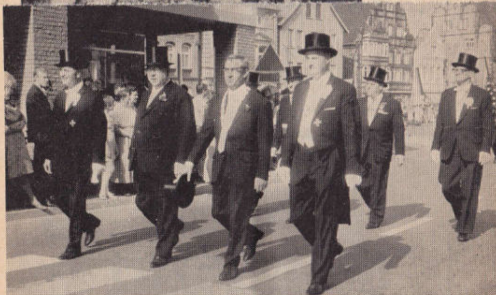
Bürgermeister und Festkomitee

Seit Generationen als leistungsfähig im Schaumburger Land bekannt.