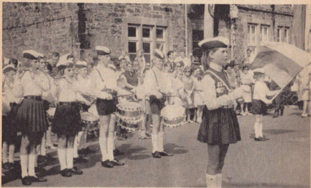
Der Schülerspielmannszug Stadthagen