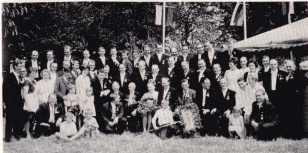
Rott St. Annen / Linden 1961 Wilg. Lambrecht

Herausgegeben vom General-Anzeiger-Verlag