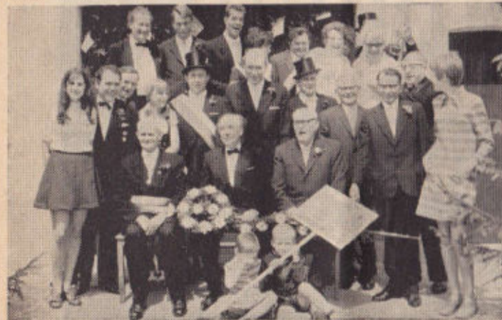
Rott Loccumer Land

Seit Generationen als leistungsfähig im Schaumburger Land bekannt.